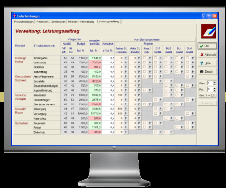
Entscheidungsparameter Leistungsauftrag (Verwaltung)